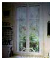
Fenêtres et porte-fenêtres bois